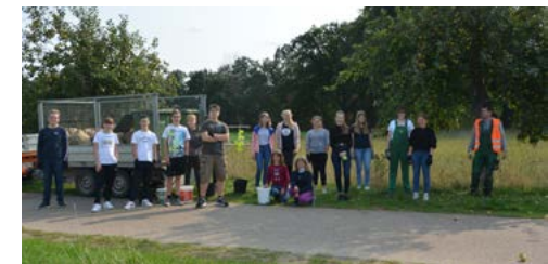
[Text & Bild: Tina Meyn]

Gottesdiensten die Gelegenheit, eine hübsch etikettierte Flasche „Laurentiussaft 2020“ zu erhalten und damit die Konfirmandenarbeit der Laurentiusgemeinde zu unterstützen. Lecker für den eigenen Frühstückstisch und ein schönes Herbstgeschenk aus unserer Kirchengemeinde für Verwandte und Freunde.